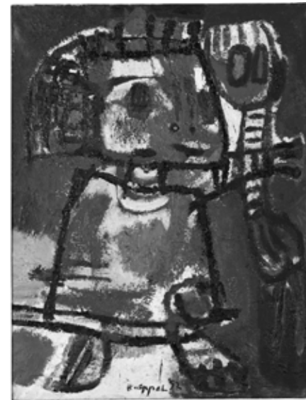
15 Karel Appel, Kind met speelgoed (Child with Toy) , 1952, oil on canvas, 116×89 cm