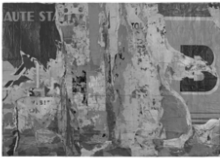
01 Jacques de la Villeglé, Avenue de la Liberté (Charenton) , 1961, paper on canvas, 159×229 cm