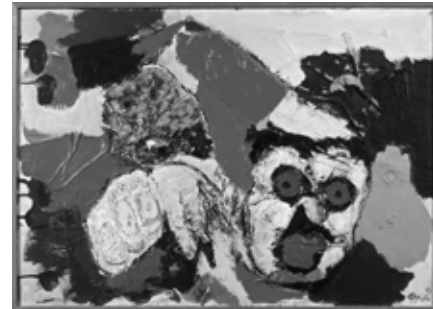
09 Karel Appel, Untitled , 1963, gouache, color crayon, and collage on paper, 70×100 cm