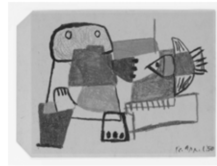
14 Karel Appel, Vragende kinderen no. 1 (Questioning Children no. 1) , 1950, wax crayon on paper, 24×32 cm