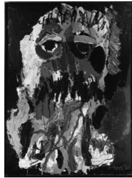
11 Karel Appel, Portrait de César , 1956, oil on canvas, 159×115,5 cm