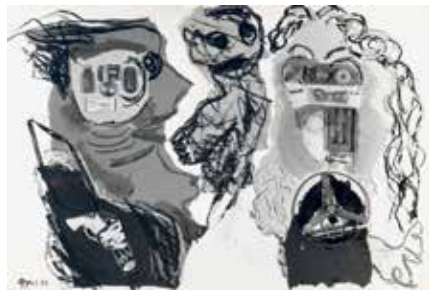
06 Karel Appel, La famille , 1963, first state with plastic toys, 69×98 cm