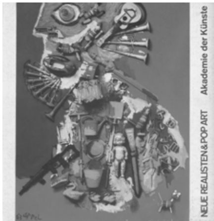
04 Karel Appel, Woman with Flowers no. 1 , 1963, plastic flowers and oil on canvas, 115×90 cm