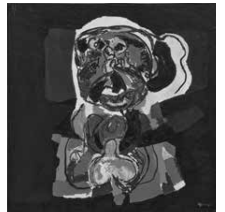
18 Karel Appel, Man , 1968, oil on canvas, 200×200 cm