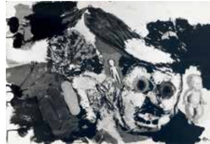
08 Karel Appel, Untitled , 1963, first state with plastic toys, 70×100 cm