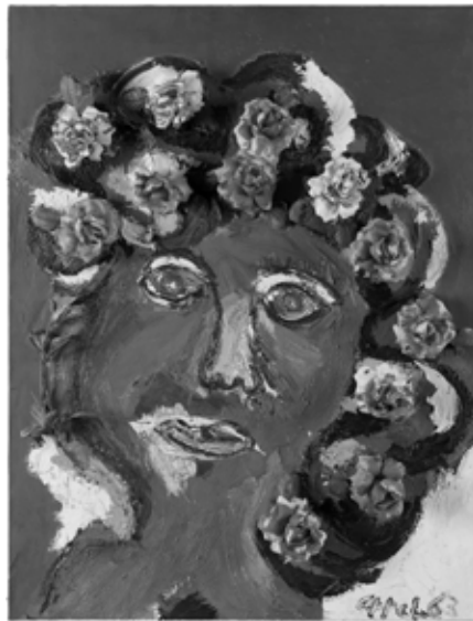
05 Karel Appel, Woman with Flowers no. 4 , 1963, plastic flowers and oil on canvas, 115×89 cm