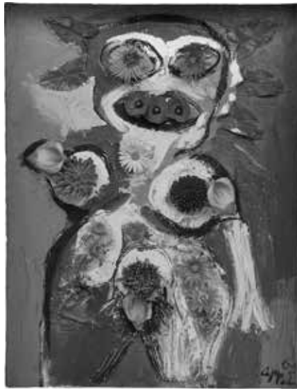
04 Karel Appel, Woman with Flowers no. 1 , 1963, plastic flowers and oil on canvas, 115×90 cm