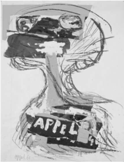
20 Karel Appel, Dans la matinee , 1961, mixed media and collage on paper, 65.1 × 49.8 cm

Mangeur d'annonces . Zwischen Materiallust und Malerei Nadine Seligmann