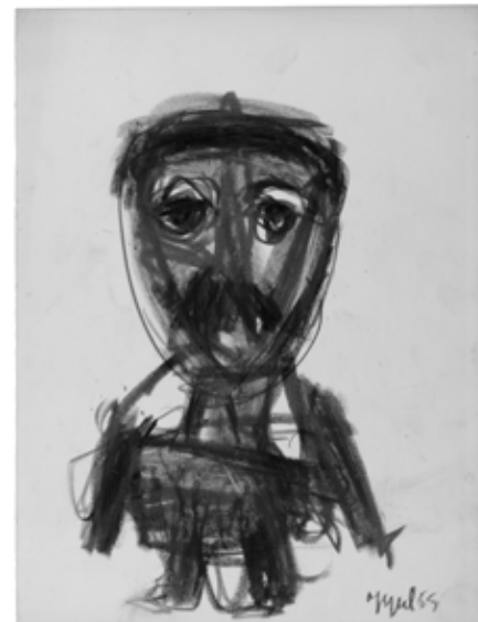
10 Karel Appel, Portrait de César , 1955, color crayon on paper, 36×27 cm