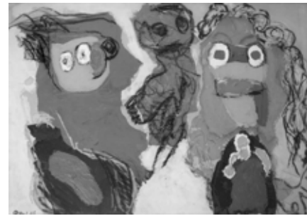
07 Karel Appel, La famille , 1963, collage on paper, 69×98 cm