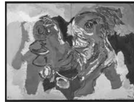
16 Karel Appel, Couple , 1965, oil on canvas, 195×260 cm