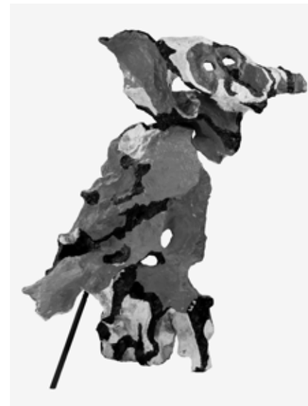
12 Karel Appel, L'homme hibou no. 1 , 1960, acrylic on olive tree stump, 157×90×52 cm