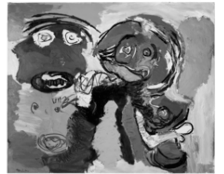
17 Karel Appel, Couple with Dog , 1966, oil on canvas, 190×230 cm