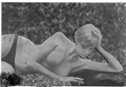
03 Martial Raysse, Simple and Quiet Painting , 1965, oil on canvas, photograph on cardboard, and plastic, 130×195 cm